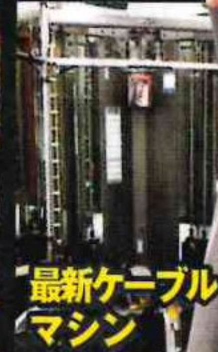
最新ケーブル マシン