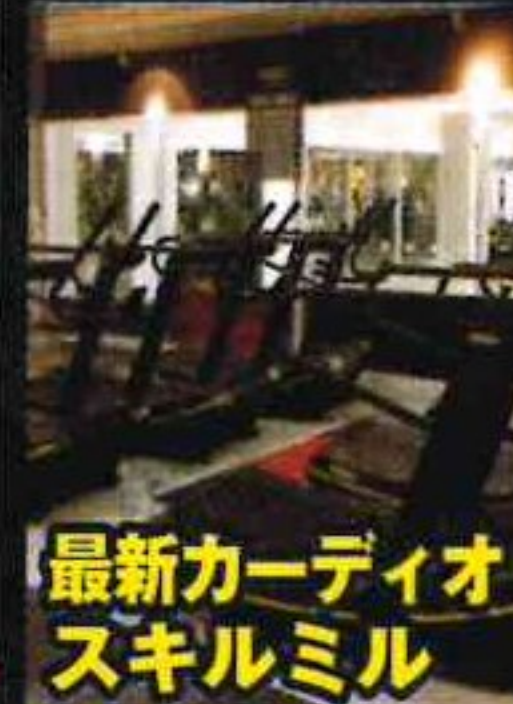
最新カーディオ スキルミル